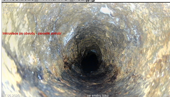
07.06.2025_ K na WC _F03.jpg